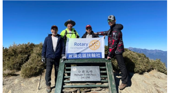
▲合歡山群峰（合歡山北峰海拔 3422M）