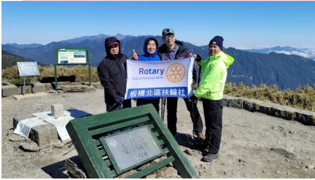
▲合歡山群峰（石門山海拔 3237M）