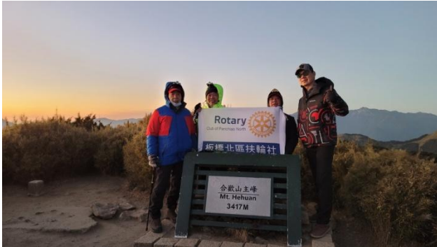
▲合歡山群峰（合歡山主峰海拔 3417M）