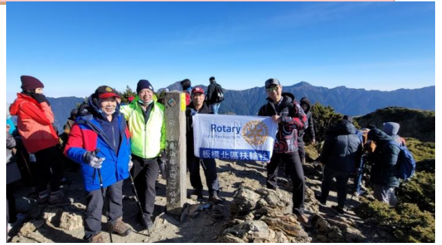
▲合歡山群峰（合歡山東峰海拔 3421M）