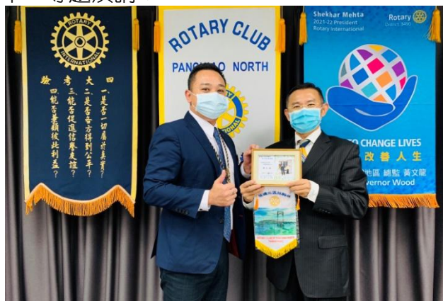
☺ 一月份慶生活動剪影