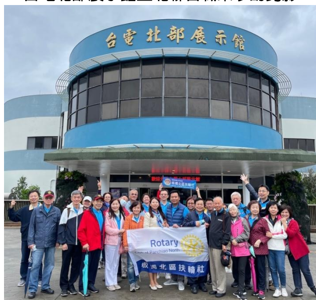
台電北部展示館五北聯合職業參訪剪影