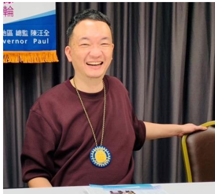
PP Building 擔任副社長