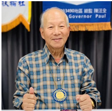
PP Land 擔任社長當選人