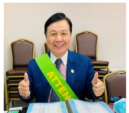
PP Sony 擔任出席