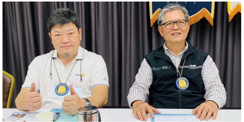
PP Benz 與 PP Tea 擔任顧問