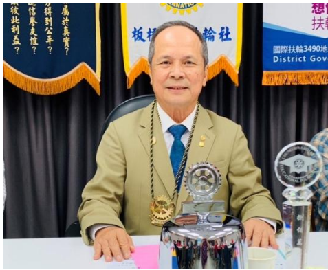
PP Bear 擔任社長