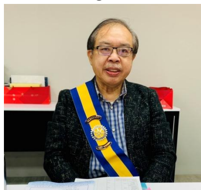
PDG ENT 擔任糾察