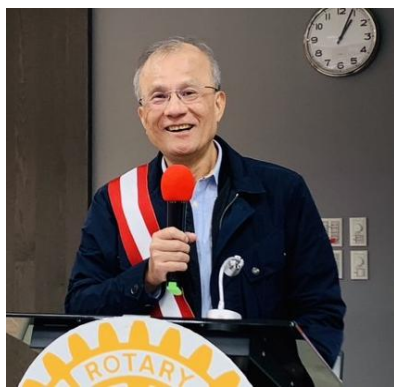
PP Alpha 擔任聯誼