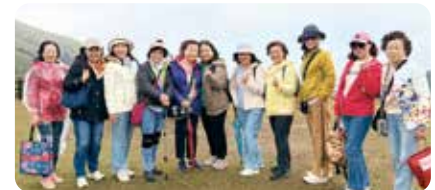
▲ 今年度主委們領軍打造運動盛宴：高球國內各賽事、泰國外地賽、地區桌球賽、登七星山、泳渡日月潭，全體社友齊眷跟著社長腳步，上山下海、活力趴趴 GO！