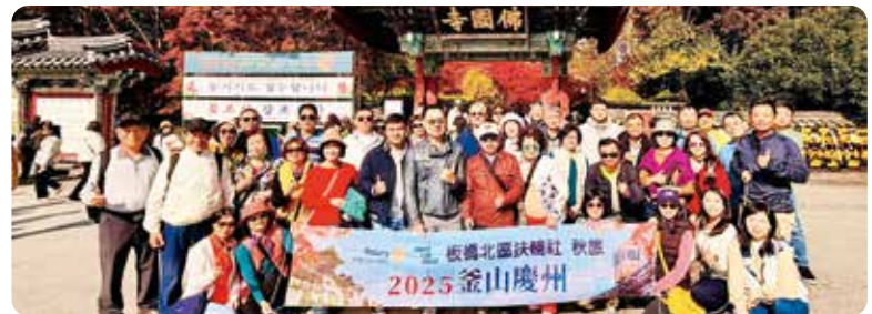
▲ 走訪佛國寺、石窟庵等世界文化遺產，乘坐松島海上纜車與海雲台膠囊列車，展開一場兼具人文底蘊與自然風光的典藏賞楓之旅！