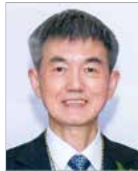
李老丁 P.P. CNC