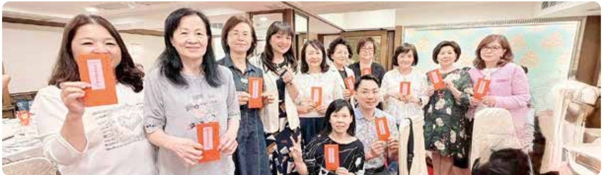
▲ 在龍都酒樓歡聚一堂，舉辦母親爐邊會！準備了母親節禮金與伴手禮，感謝寶尊眷夫人們的辛勞，向偉大的母親獻上最高敬意與祝福。