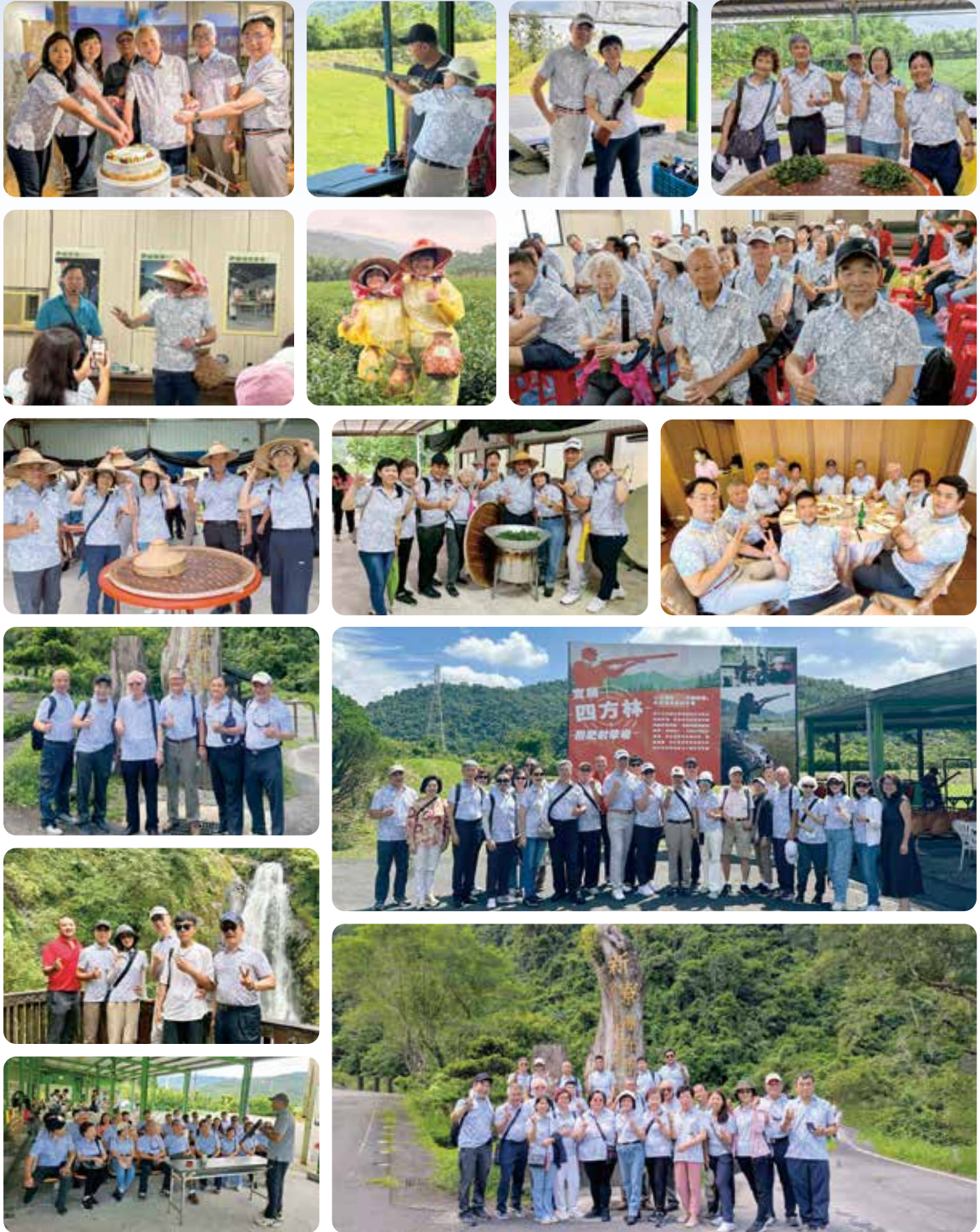
▲ 社長精心規劃打靶與茶園體驗，全體社友與寶眷齊聚歡慶父親節！活動刺激有趣、笑聲不斷，大家共享溫馨歡樂的時光，留下難忘回憶。