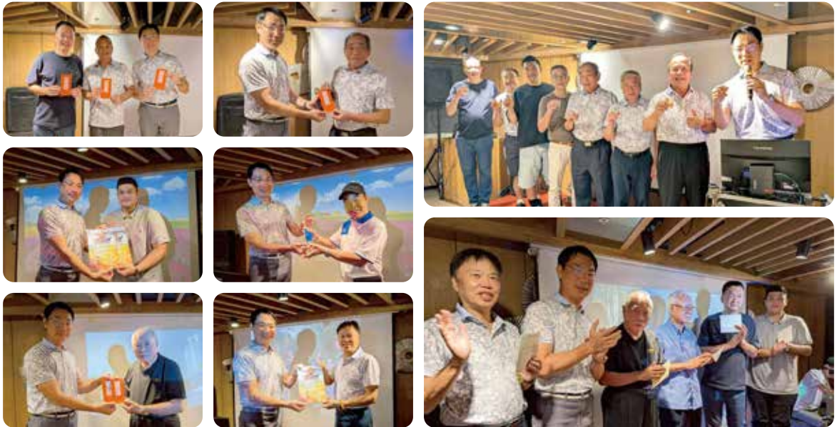
▲ 年度中秋爐邊會於歡愉氛圍中舉行，安排卡拉 OK 歡唱與生日慶賀，並頒發社友子女金榜獎學金，表彰泳渡日月潭之壯舉。活動兼具雅趣與榮耀，意義深遠。