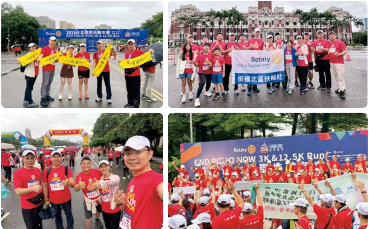
▲ Luke 社長伉儷熱情號召，全體社友與寶眷齊聚 2026 台北國際扶輪年會「根除小兒麻痺」路跑活動，以實際行動展現扶輪精神與活力，凝聚眾人力量，共同推動全球公共衛生使命。