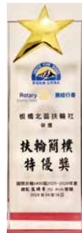
地區年會 扶輪簡樸特優獎