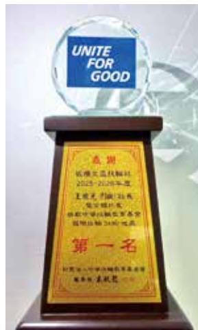
中華扶輪教育基金 年度捐款地區第一名