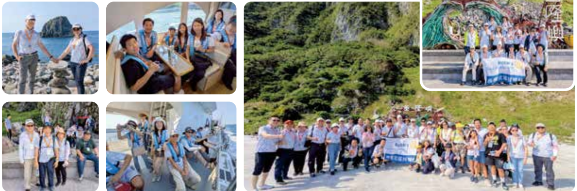
▲ 社長偕同社友寶眷前往基隆嶼，展開登島健行與繞島巡航之旅。大家在欣賞壯麗火山地貌與季節花卉的同時，深刻感受別具特色的海島探索活動。