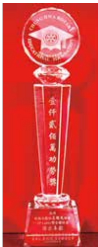
中華扶輪教育基金 壹仟貳百萬功勞獎