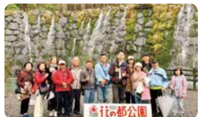
▲ 今年春季之旅，社友與夫人們漫步日本街巷，欣賞富士山的山光水色，櫻花飄落如詩。大家品嚐美食、暢談交流，在笑語與酒香中留下美好回憶。