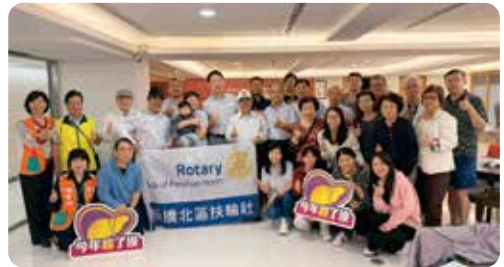
▲ 為響應政府以及台灣扶輪消除 C 肝政策，本社持續支持肝病防治與篩檢計畫，盼為肝病防治而努力。感謝 H.D. P.P. 專款捐助，助力預防 C 肝工作，展現扶輪團結行善之精神。