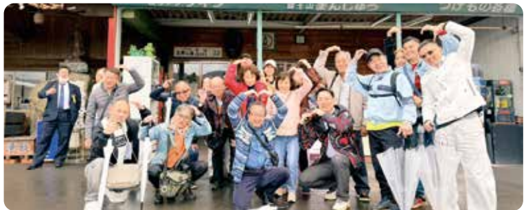
▲ 春旅期間訪問日本神戶西神社，兩社舉行聯合例會。本社受到姊妹社的熱情款待，充分展現兩社間深厚的友誼與良好的交流，進一步鞏固國際扶輪的合作精神。