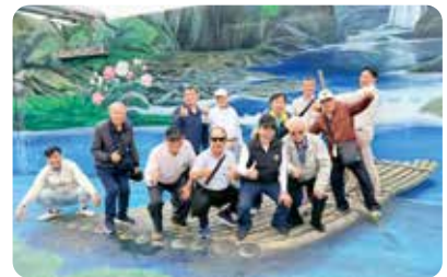
▲ 社長帶著全體社友實眷參訪茶鄉坪林，深入了解當地的歷史發展及風情文化，並品嚐新鮮美味的特色茶餐料理。