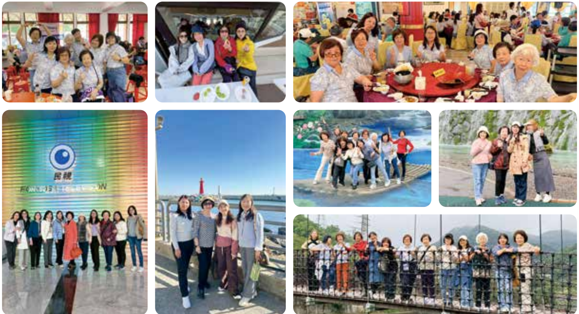
▲ 在社長夫人的號召下，寶眷夫人們踴躍參與扶輪活動，彰顯活力、魅力四射！