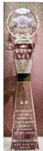
中華扶輪教育基金 年度捐款全國第十名