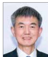
李老丁 P.P. CNC